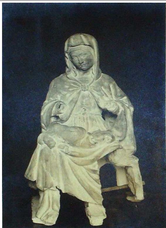
(b. 1, fasc. 12)