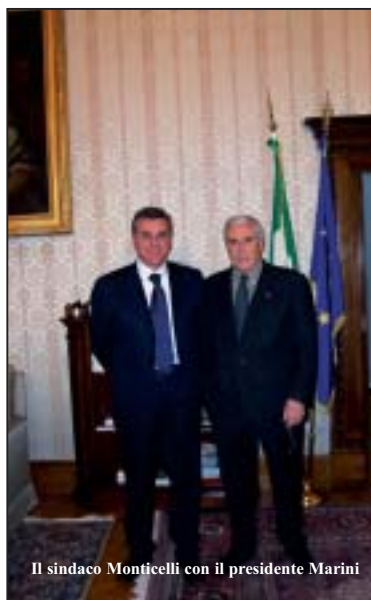
Il sindaco Monticelli con il presidente Marini

tadini di Pineto che ormai mi conoscete da tempo, lasciatemi dire, di non pensare che l'alta carica, alla quale i senatori mi hanno eletto, abbia mutato più di tanto il mio modo di essere». Queste le prime parole pronunciate dal presidente Marini durante l'incontro. «Sono sempre vicino alla vita politica e sociale dell'accogliente cittadina pinetese, per vedere e ascoltare da vicino i problemi e le potenzialità». Al termine del colloquio il presidente del Senato ha donato al primo cittadino pinetese una copia del libro che illustra la storia di Palazzo Madama.